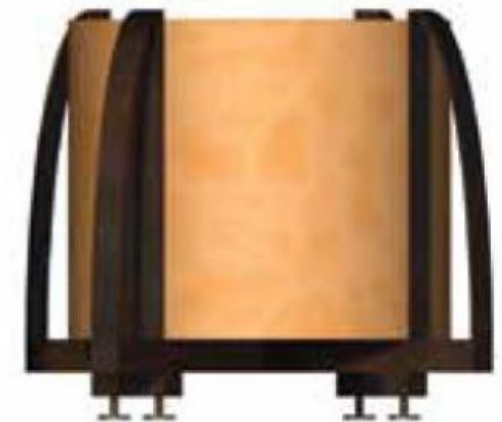
Avec support ailes